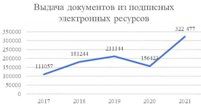
Рис. 6. Показатели выдачи документов из подписных электронных ресурсов в библиотеках научных учреждений УрО РАН, 2017–2021 гг.