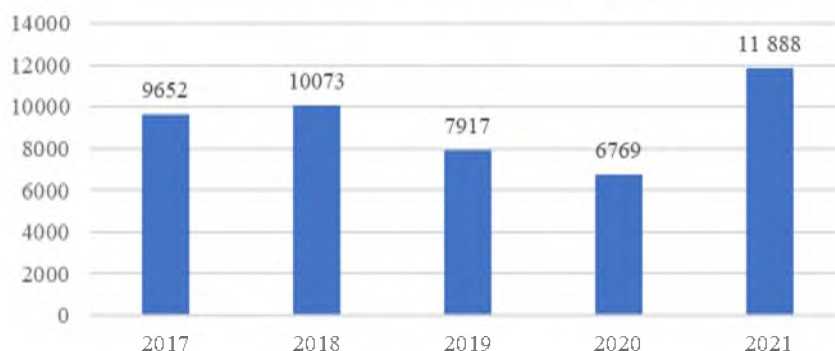
Рис. 1. Количество пользователей библиотек научных учреждений УРО РАН, 2017–2021 гг.