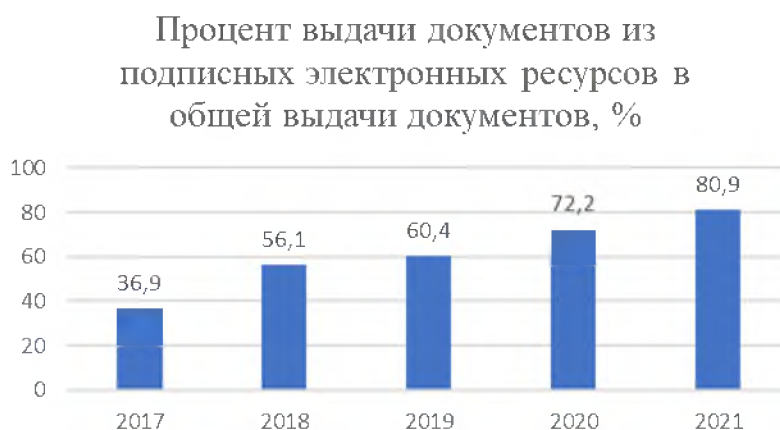
Рис. 7. Процент выдачи документов из подписных электронных ресурсов в общей выдаче документов в библиотеках научных учреждений УрО РАН, 2017–2021 гг.