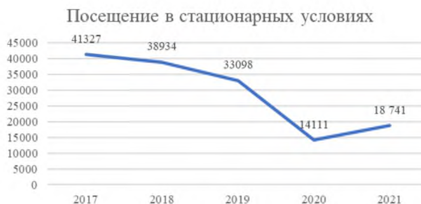
Рис. 3. Количество посещений библиотек научных учреждений УрО РАН в стационарных условиях, 2017–2021 гг.