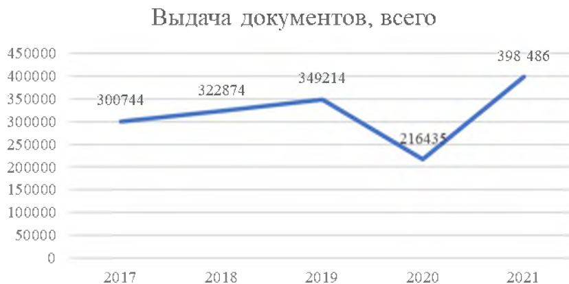
Рис. 5. Показатели выдачи документов в библиотеках научных учреждений УрО РАН, 2017–2021 гг.