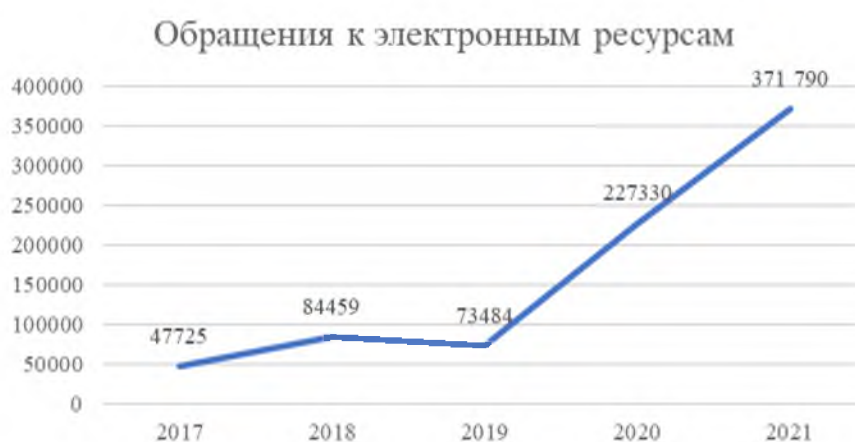
Рис. 4. Количество обращений к электронным ресурсам в библиотеках научных учреждений УрО РАН, 2017–2021 гг.

Рост количества обращений к электронным ресурсам обусловлен развитием системы национальной и централизованной подписки на научные информационные ресурсы, которая предоставила пользователям библиотек доступ к широкому кругу актуальной научной информации.