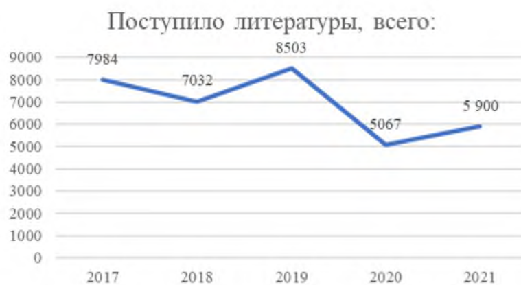
Рис. 8. Показатели поступлений литературы в библиотеках научных учреждений УрО РАН, 2017–2021 гг.

Рост показателей обслуживания в электронной среде в библиотеках УрО РАН в 2017–2021 гг. показывает, что расширение возможностей дистанционного обслуживания и организация эффективного доступа к отечественным и зарубежным полнотекстовым электронным ресурсам является актуальным направлением развития библиотек сети. Это направление во многом зависит от экономических и политических факторов, влияющих, в частности, на централизованную (национальную) подписку на научные информационные ресурсы. Нестабильность или отсутствие доступа к удаленным информационным ресурсам, в первую очередь, к зарубежным, может оказать негативное влияние на качество информационного обслуживания пользователей.