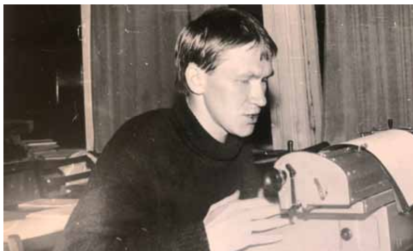
Ил. 2. Сотрудник Лаборатории археографических исследований УрГУ