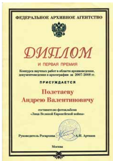
Ил. 5. Диплом Федерального архивного агентства