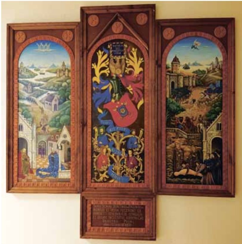
Ил. 8. Гербовая композиция с гербом исторического факультета (создатели: А. Полетаев, Д. Редин, Е. Черняк и В. Цукерман)