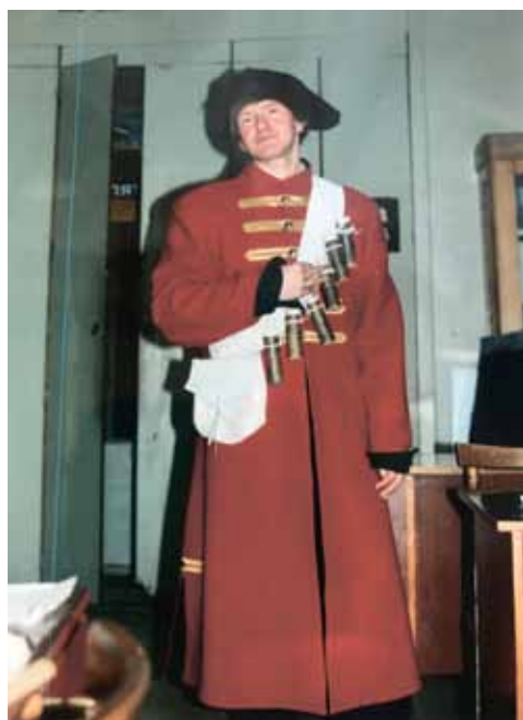
Ил. 4. На кафедре этнологии и вспомогательных исторических дисциплин УрГУ