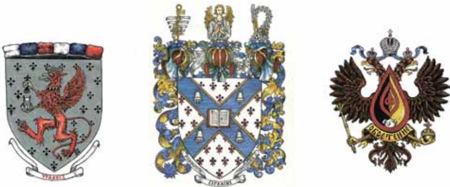
Ил. 9. Рисунки гербов (автор — А. В. Полетаев)