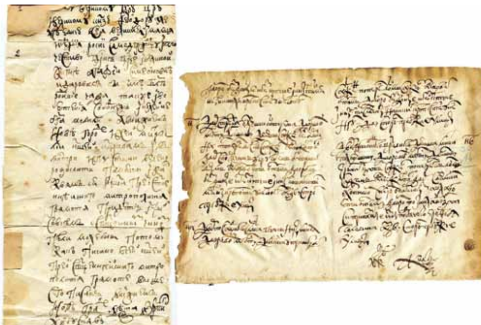
Ил. 6. Копии документов XVII в., выполненные А. В. Полетаевым