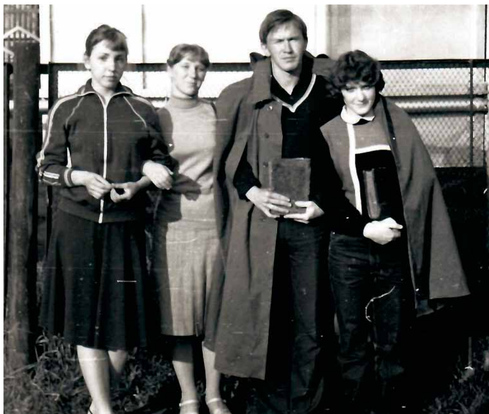
Ил. 1. В одном из отрядов Уральской археографической экспедиции, 1986 г.