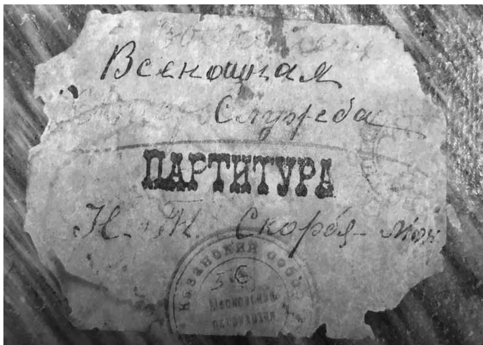
Ярлык «Всенощная Служба. Партитура Н.-Т. Скорбя[щенского] мон[астыря]». ЕДС РК № 43200